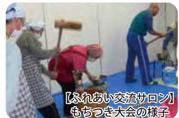
【ふれあい交流サロン】 もちつき大会の様子