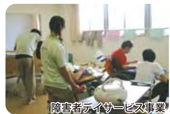
障害者デイサービス事業