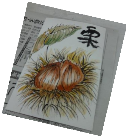
「栗」の字はあえて左手で書いて、趣きを・・・