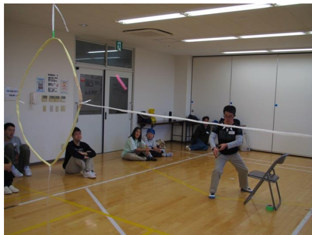
フライングディスク!